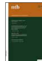
Nederlands tijdschrift voor Bestuursrecht.