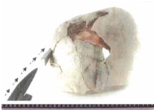
Figuur 3: Passing van de lange klauw in opening B.

Merk op dat er zonder meer wordt aangenomen dat de schedelopeningen A, B en C plaatsen van impact zijn. Dat komt hieronder nog aan de orde, evenals de ronde opening die ik verdere opening X zal noemen.