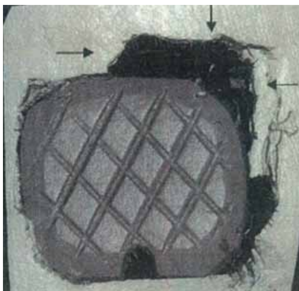
Figuur 4: Passing van de vlakke zijde van de hamer in opening C1.